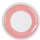
Talerz reprezentacyjny 27